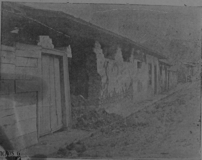
Tres Ríos.-Una calle de la población. Casas destruidas