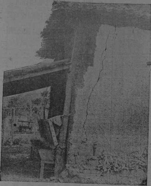
Curridabat.-Parte posterior de la casa de D. Rafael Alvarad (Chotarra) que quedó en ruinas