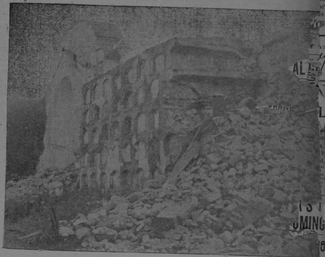
Tres Ríos.-Destrozos en el Cementerio, lado norte