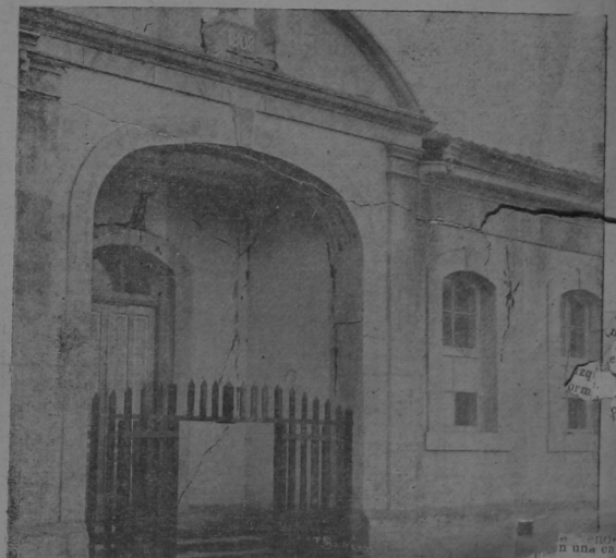
Tres Ríos.-Portal del edificio escolar, que quedó in-