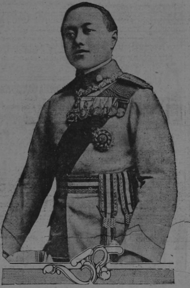
El Rey de Siam, ha manifestado ardientes deseos de visitar la América y dice un periódico parisien que nada de extraño tiene que los americanos nos demos el placer de ver por estas tierras una testa coronada.