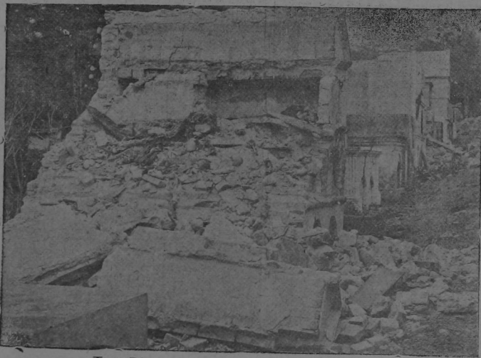
Tres Ríos.-Interior del cementerio. Bóvedas destruidas